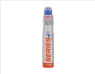
Eurocode 300348 CARTOUCHE DE GAZ (1X) - IM90 / PPN50 / COMBI