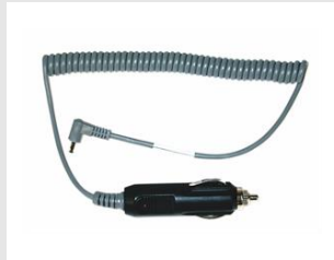
Eurocode 900507 ADAPTATEUR DE VOITURE 12V - PULSA / IMPULSE