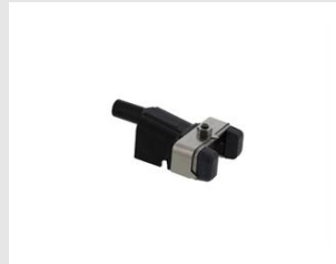
Eurocode 019783 PALPEUR NO-MAR BARDAGE - IM90Xi