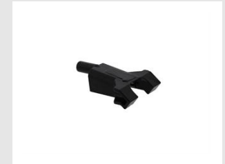
Eurocode 019784 PALPEUR & LANGUETTE - IM90Xi