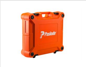
Eurocode 014016 COFFRET COMBI XI & XI