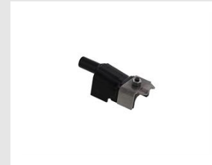
Eurocode 019785 PALPEUR TUILE ACIER - IM90Xi