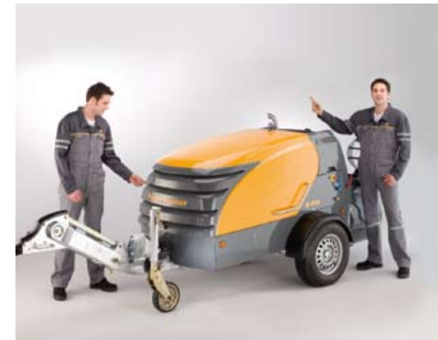
Le guidage d'air intelligent protège l'homme et la machine. L'aspiration est réalisée à l'avant sans poussières et l'évacuation a lieu à l'arrière.