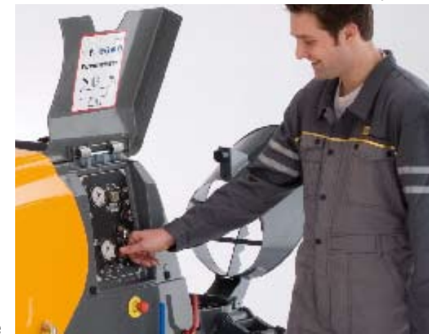
Le tableau de commande est ordonné et „sobre“. Une trappe pratique et robuste sert de protection contre les salissures.