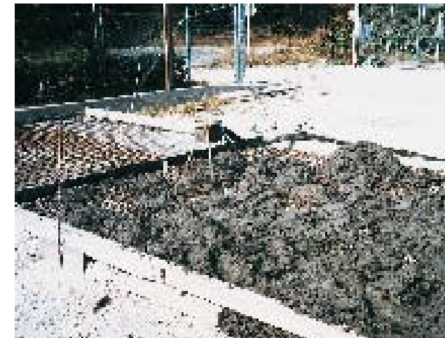
Elle transporte sans problème même du béton d'une granulométrique max. de 20 mm sur une grande distance.