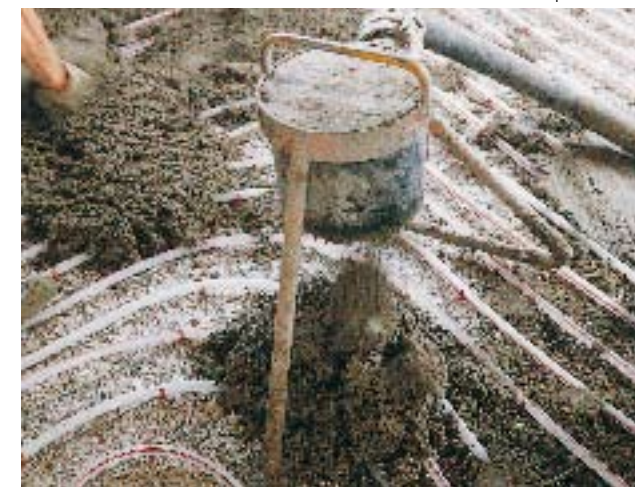
... sable et gravillons (p. ex. dans le cas d'une forme d'égalisation isolante avec de l'argile expansée).