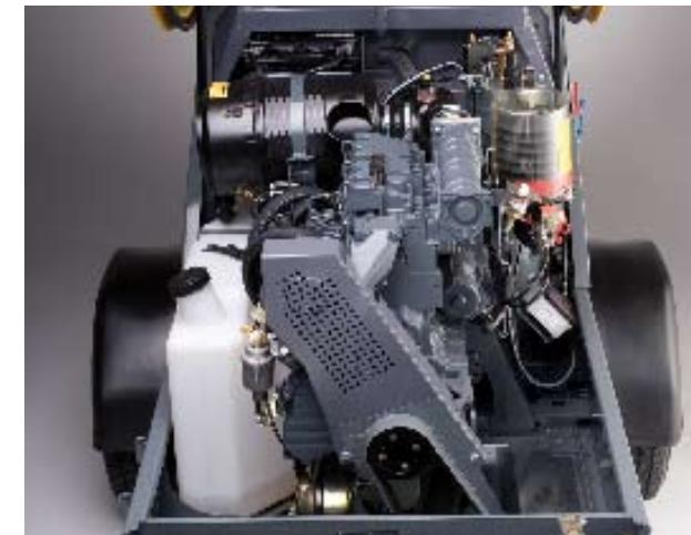
Le nouveau moteur diesel est installé en ligne. L'ensemble est ainsi bien rangé et accessible.