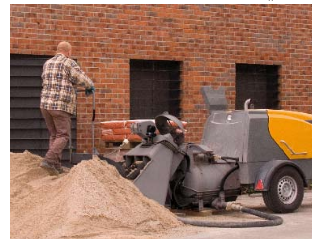
La nouvelle mixo dans la version avec skip et scraplette.