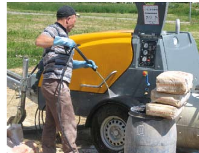
En option, la Mixokret peut aussi être équipée d'un nettoyeur haute pression performant.