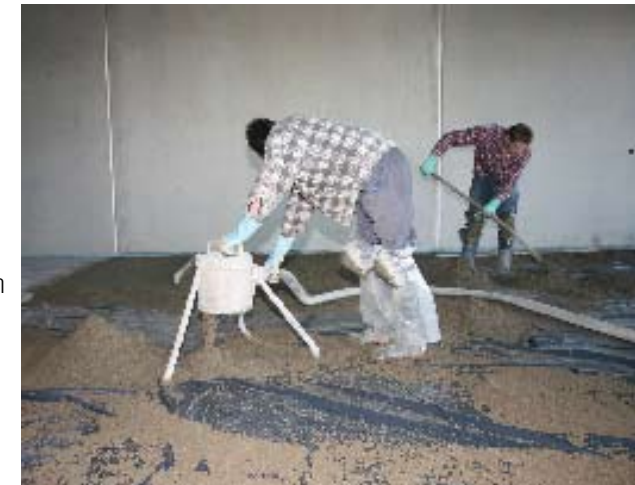
Le Mixokret transporte les fluides les plus divers. Chapes.

Vous pouvez aussi le faire transporter très facilement par une grue, pratiquement partout.