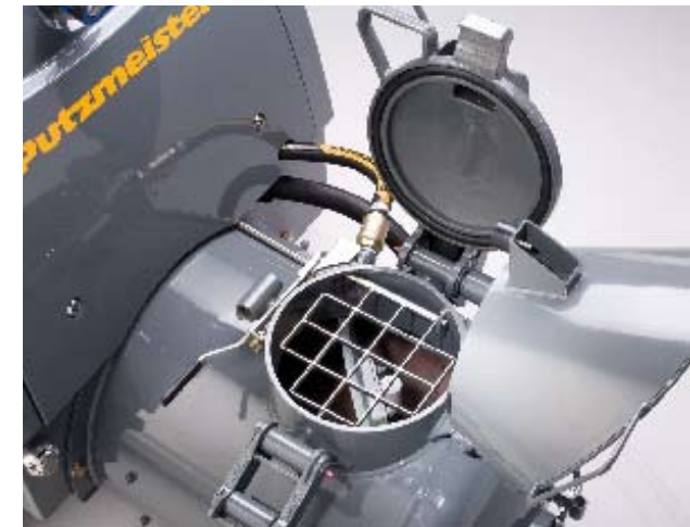
Désormais, vous pouvez déterminer au choix la position du couvercle sur la nouvelle cuve.