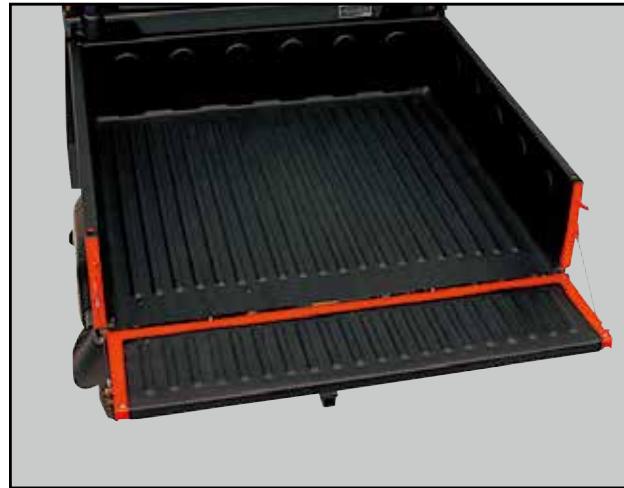
■ Protection de la Bennette