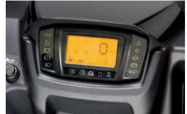
Tableau de bord avec affichage numérique

La servodirection hydrostatique réactive vous garantit un maximum de contrôle sans effort pour affronter n'importe quel terrain. Le volant s'ajuste en inclinaison, pour permettre à chacun d'effectuer ses réglages en fonction de sa morphologie.