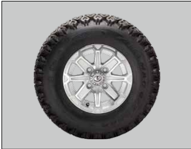
■ Jantes en aluminium